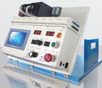
TW1000 (MINI ORDER 5台) 430x560x350mm